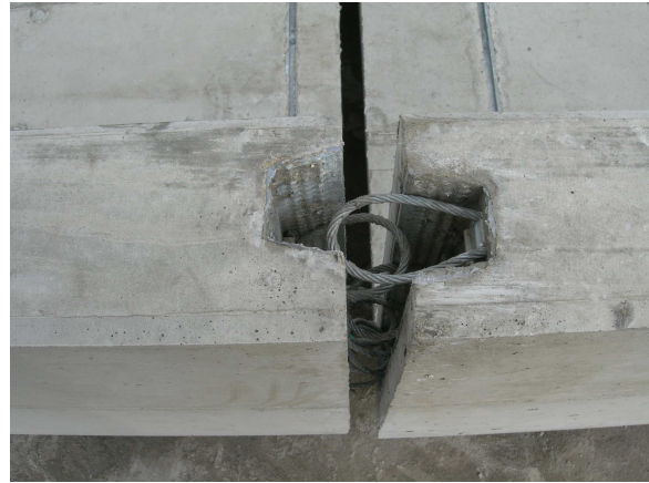
Verbindungssystem mit Pfeiffer- Schlaufenschienen